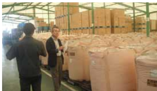
河野工場更新審査

また環境表彰制度を設けており、特に環境管理活動で優れた事業所には表彰を行っています。