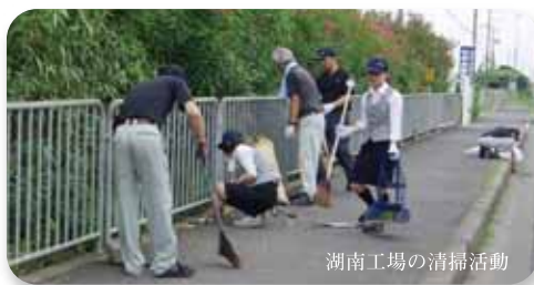
湖南工場の清掃活動

大宝グループ各社では、環境活動の一環として、定期的に工場周辺の清掃活動に取り組み、周辺地域の美化を推進しています。