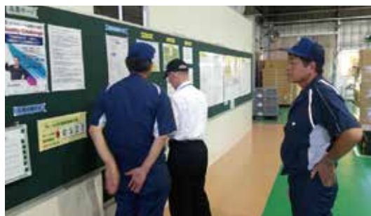
足利工場更新審査

また環境表彰制度を設けており、特に環境管理活動で優れた事業所には表彰を行っています。