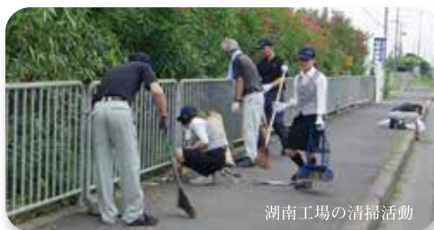
湖南工場の清掃活動

大宝グループ各社では、環境活動の一環として、定期的に工場周辺の清掃活動に取り組み、周辺地域の美化を推進しています。