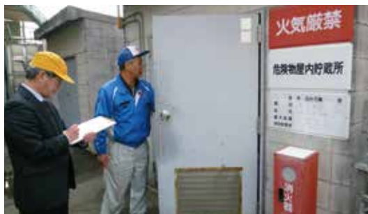
タイロン移行審査