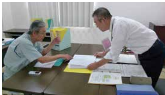
湖南工場サーベイランス審査

また環境表彰制度を設けており、特に環境管理活動で優れた事業所には表彰を行っています。